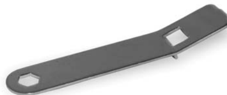
Специальный ключ необходим для работ с триммерной головкой